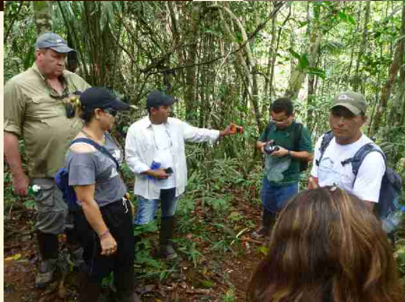
Anavilhanas Jungle Lodge