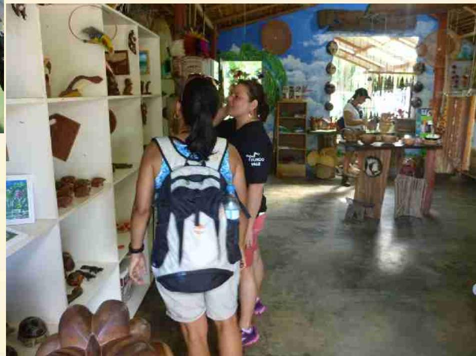
Pousada e Loja em Novo Airão.