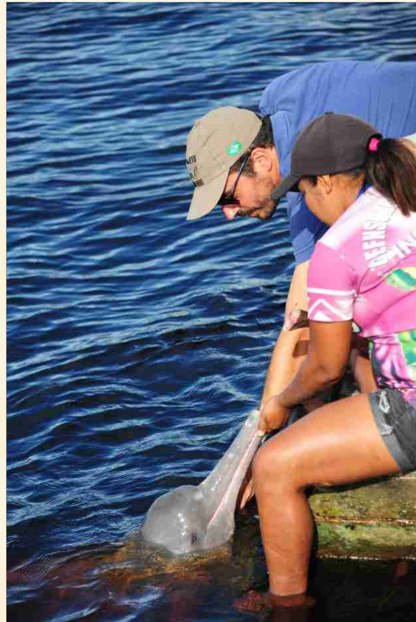
Flutuante dos Botos – Novo Airão