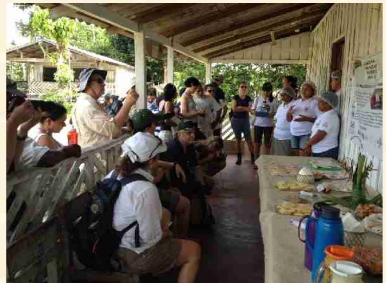
Comunidade São Sebastião – RDS Poranga Conquista