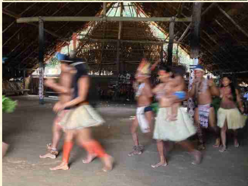
Comunidade São João do Tupé – RDS Tupé